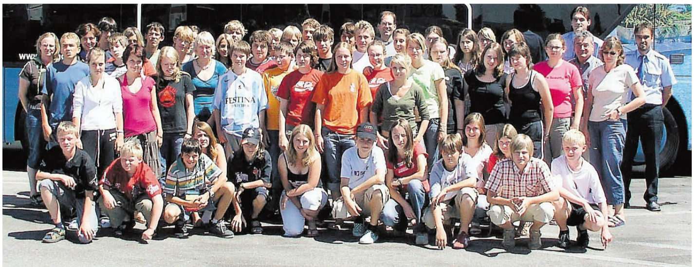
Auch aus Pfaffenhofen und dem nördlichen Landkreis machten sich die Ministranten auf den Weg nach Rom.

Einige der Ministranten sahen den Papst in seinem „Papamobil“ ganz nah vorbeifahren. Trotz der Hitze wurden auch viele Sehenswürdigkeiten Roms, u.a. Petersdom, Laterankirche, Pantheon, Trevibrunnen, Kolosseum, Forum Romanum, die Katakomben von San Castillo, besichtigt – viele Kilometer liefen die Mini's durch Rom. Von vielen Eindrücken und persönlichen Begegnungen erfüllt, ging es am Freitagmorgen wieder Richtung Heimat.