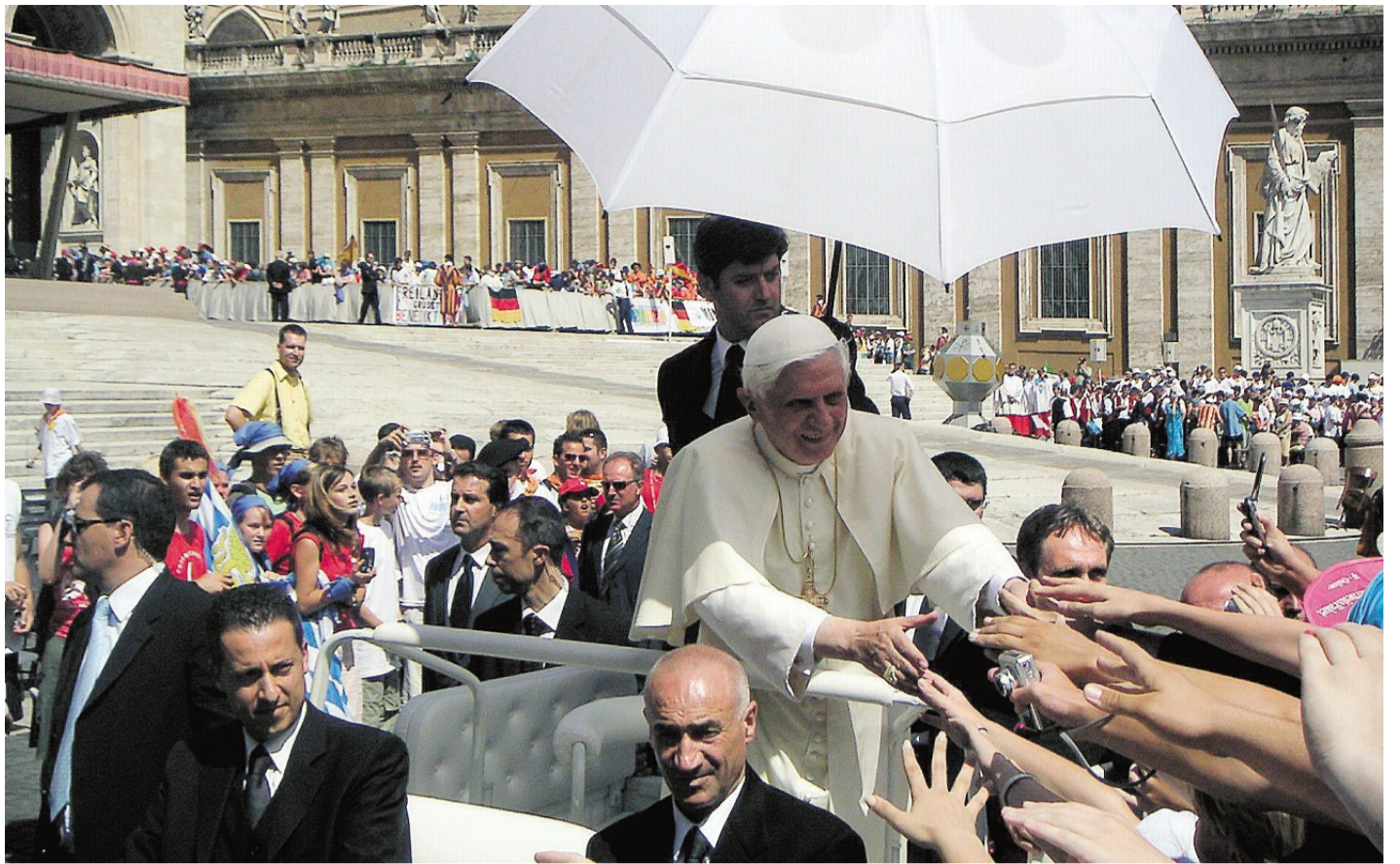
Ganz nah fuhr Papst Benedikt XVI. mit dem Papamobil auch an den Ministranten aus dem südlichen Landkreis vorbei – und viele Hände reckten sich ihm entgegen. Im Hintergrund kann man auch das große Weihrauchfass erkennen, das anlässlich der internationalen Ministrantenwallfahrt aufgestellt wurde.

Am nächsten Morgen musste man schon um 6 Uhr aufstehen. Um 8 Uhr war der Petersplatz noch leer, aber einige Tausend standen schon an den Einlassstellen an. „Aktives Anstehen“ war nun die Parole, niemanden vordrängen lassen. So gelangte der Großteil der Scheyerer Gruppe in den vordersten Teil, auf der linken Seite, weil von dort das Papamobil gewöhnlich einfährt.