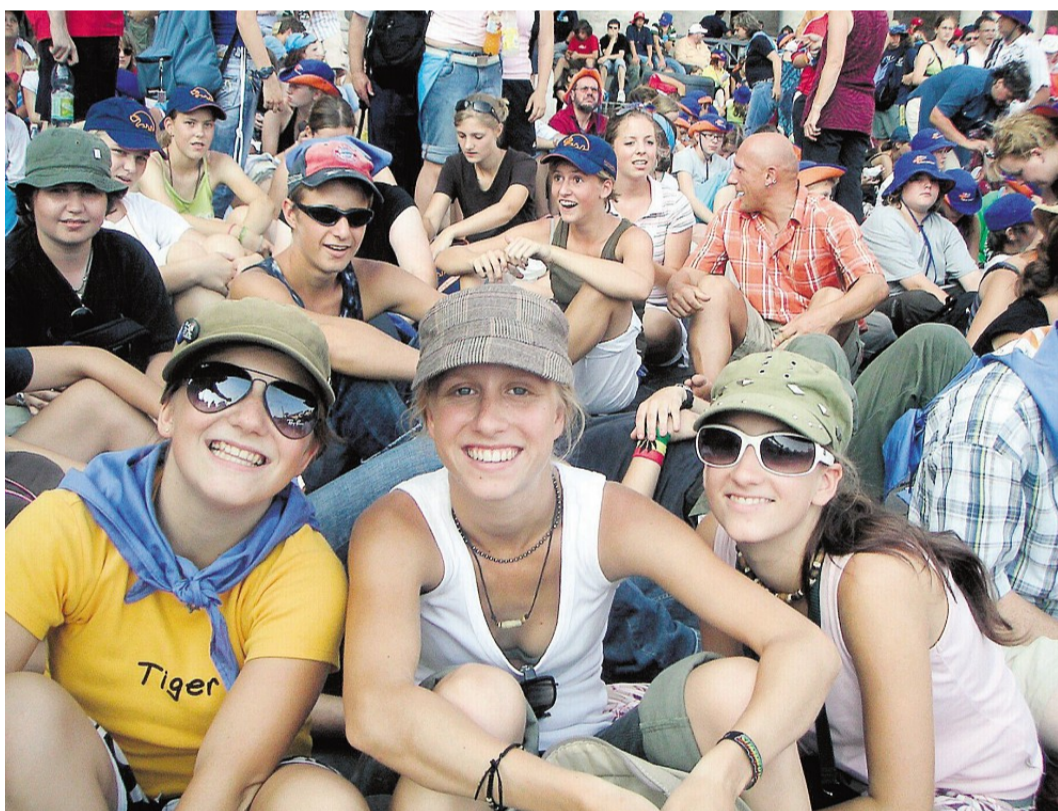
Die Stimmung war bestens, wie man sieht: Jugendliche aus dem südlichen Landkreis auf dem Petersplatz vor der großen Eucharistiefeier.

In ungekürzter Fassung ist der von Pater Benedikt verfasste Reisebericht auf der Homepage des Klosters unter der Internetadresse www.kloster-scheyern.de zu lesen.